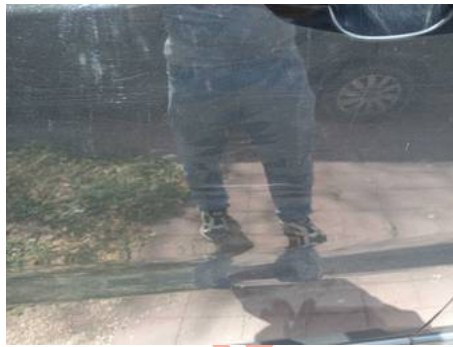
Porte avant gauche (Rayure)